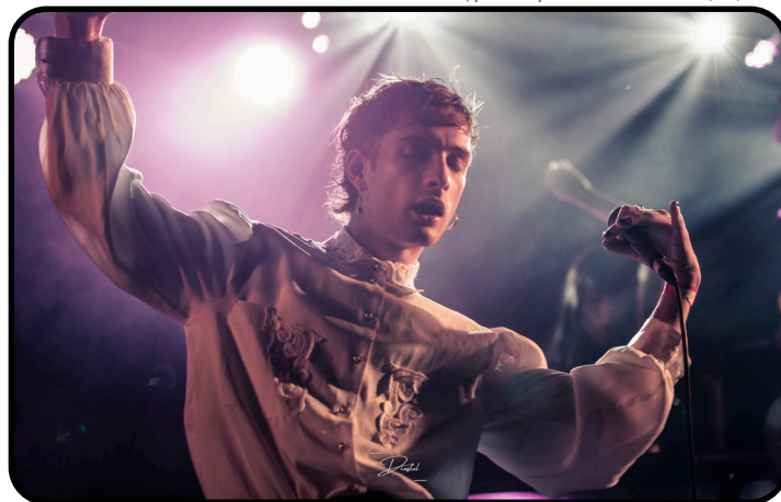
Oete, par Delphine Duchatel - 03/03/22