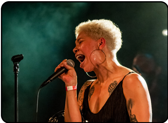
The Buttshakers, par Xavier Breuze - 02/12/21